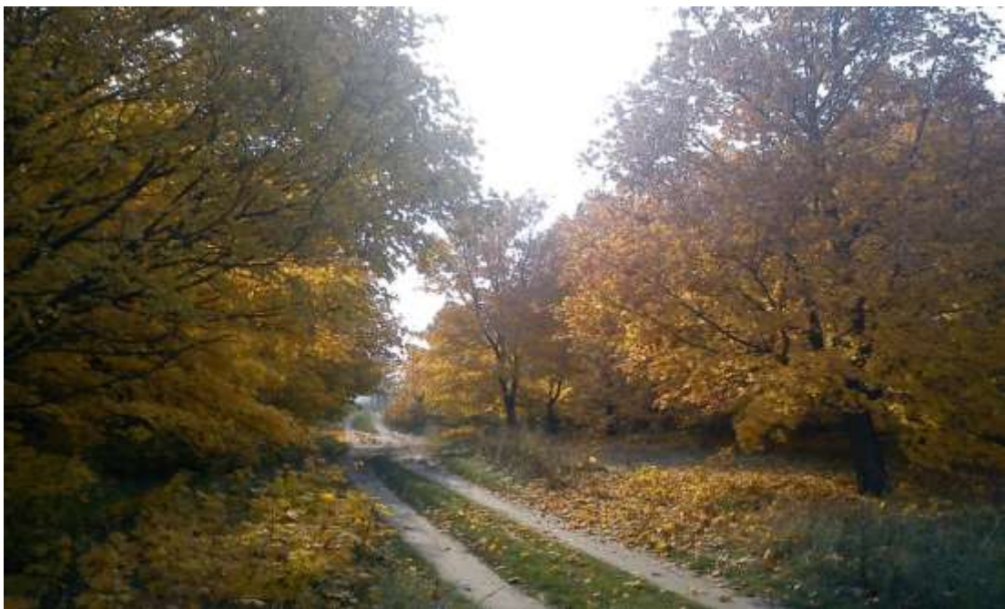
6/A A Széhlhely cseres-tölgyes erdője