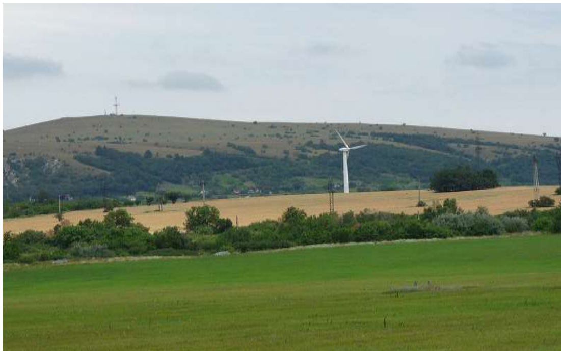
2. Az inotai Baglyas távról és a karszt kutak