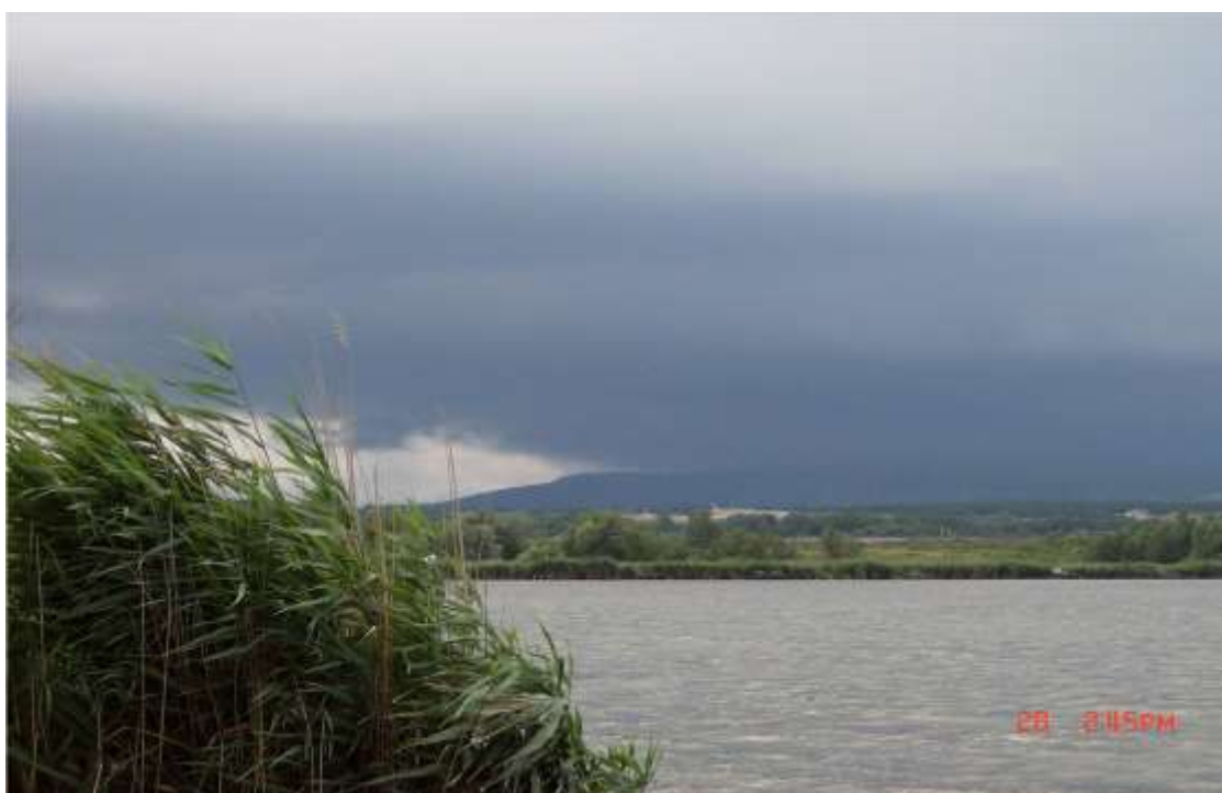
4/A A Derítő-tó egy bakonyi vihar előtt