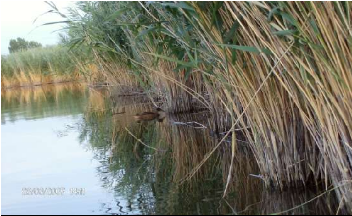
4/B A Derítő-tó élővilága