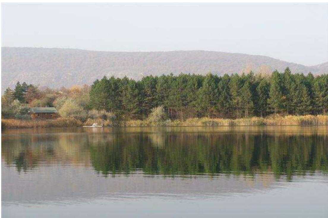
6/C A Bántai Karszt-tó