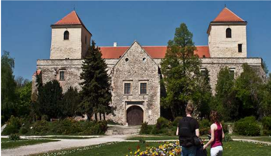
1. Várpalota jelképe, a Thuri vár a kiindulási és érkezési helyszínünk