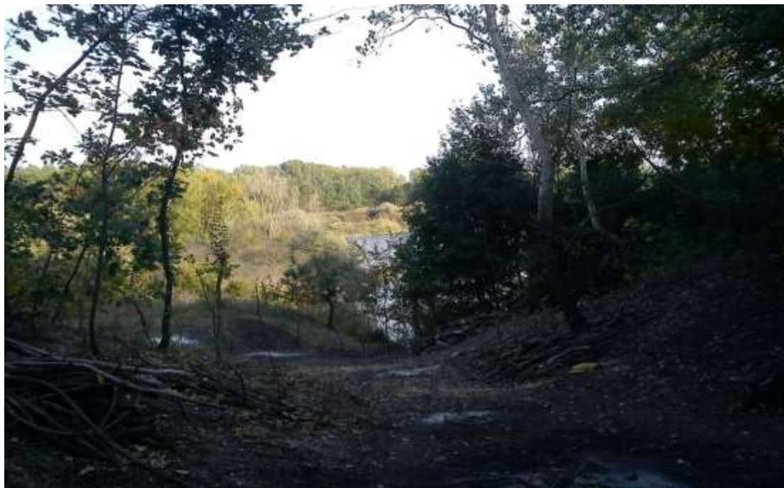
6/B A Széhlhelyi bányató