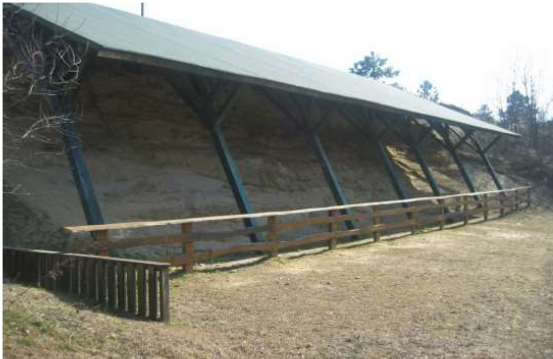
5/A A várpalotai miocén homokbánya.....