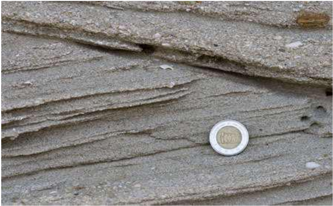
5/B .....és a bányá híres rétegsora